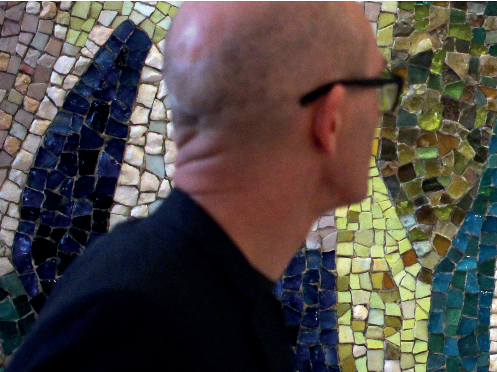
Lunds universitet | Produktion: Institutionen för kulturvetenskaper | Fotograf: Peter Bengtsen | Tryck: Media-Tryck, Lund, 2023.