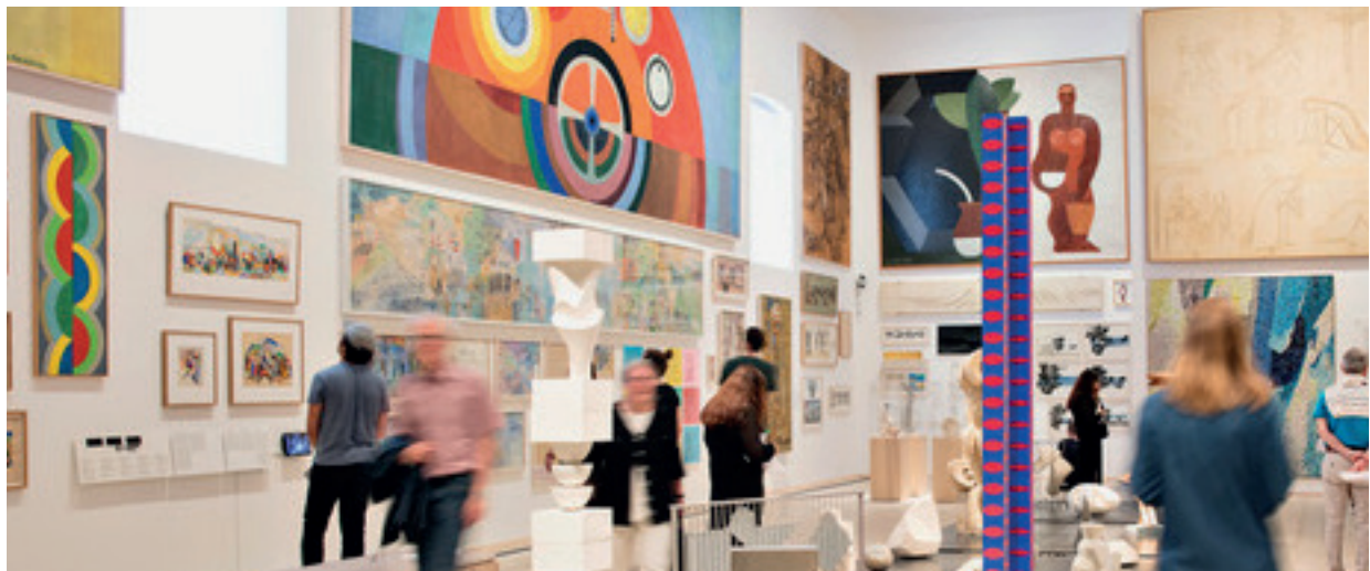
Skissernas Museum 2018

Kursen speglar de senaste årens forskning inom kultur och hälsa-fältet i Sverige, Norden och internationellt. Utbildningen svarar mot ett ökat behov av kunskap om konst, kultur och hälsa inom vård- och omsorgsverksamheter samt kulturinstitutioner, inte minst med fokus på psykisk hälsa och folkhälsa. Kursen ger studenterna teoretiska kunskaper och praktiska färdigheter som behövs för att planera och genomföra konst- och kulturaktiviteter för hälsa och välbefinnande.