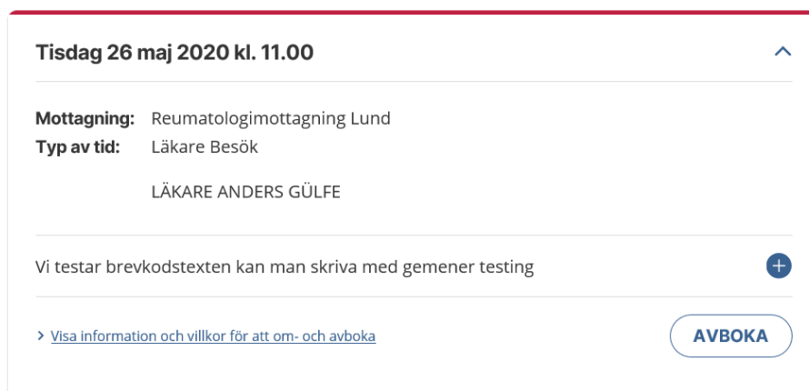
Bild 5 - Patientvy av "Bokade tider" för bokad tid på 1177-nivå 2