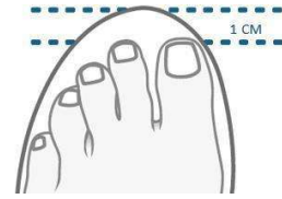
Figur 1. Skon ska vara ungefär 10 mm längre än din längsta tå.

Skon bör ha en löstagbar innersula för att vid behov kunna ersätta den med en annan innersula (Figur 2).