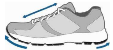
Figur 3. En "walkingsko" är rundad vid tårna och vid hälen.

För att ge en bra stabilitet i fot och ankel ska skon ha en stabil hälkappa (Figur 4).