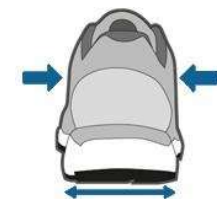
Figur 4. Skon ska ha en stabil hälkappa.

En vridstyv sula ger också ökad stabilitet (Figur 5).