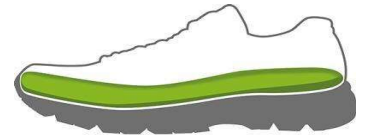
Figur 2. Skon bör ha löstagbar innersula.

För bra funktion och komfort rekommenderas en promenadsko ("walkingsko") som ger dina fötter bästa stöd och gångkomfort (Figur 3).