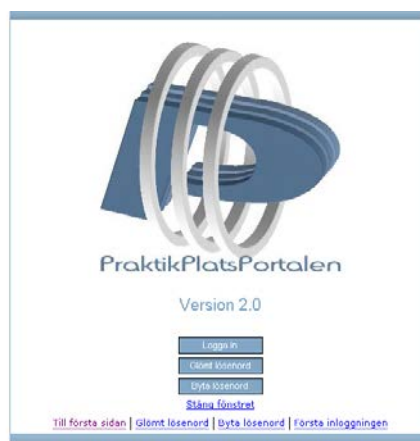
2 Välj Glömt lösenord