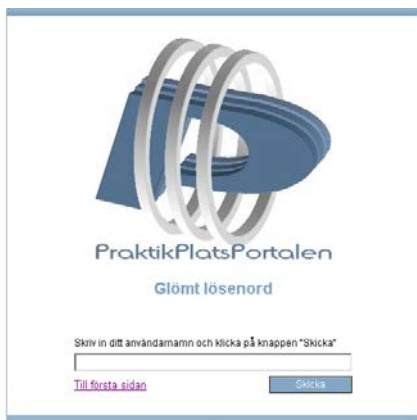
3 Skriv in din e-postadress = användarnamn Välj skicka