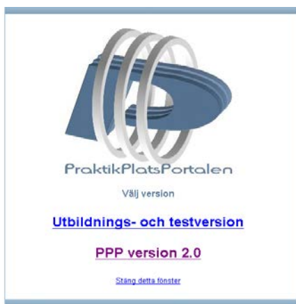
1 Välj PPP version 2.0

Skriv in internetadressen nedan i adressfältet i webbläsaren, http://www.praktikplats.skane.se/ lägg den sedan som en favorit så kommer du åt programmet snabbt i fortsättningen