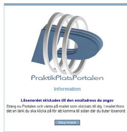
4 Lösenordet har skickats till den e-postadress du angav