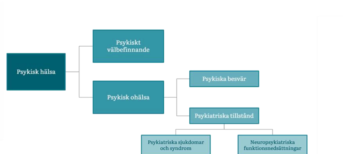
Figur 1: Schematisk illustration av begreppsramen för psykisk hälsa.