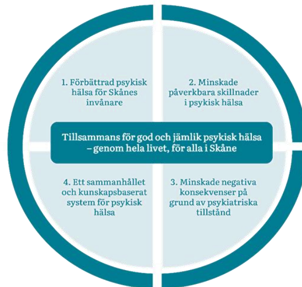
Figur 2: Illustration av Region Skånes vision och övergripande målbilder för psykisk hälsa.

Region Skåne ska erbjuda lättillgängligt, sammanhållet och evidensbaserat stöd för psykisk hälsa. Systemet ska präglas av gränsöverskridande samarbete, delaktighet och ständig utveckling, och omfatta såväl hälsofrämjande och förebyggande som behandlande och rehabiliterande insatser.