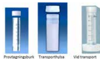
Provtagningsburk Transporthylsa Vid transport