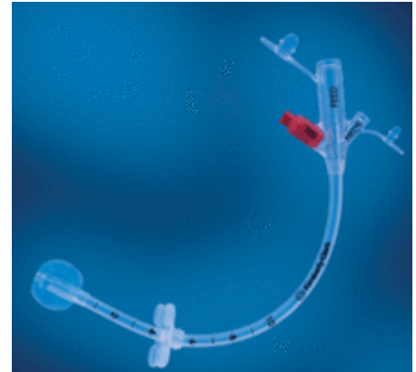
Exempel på gastrotub/ballongkateter, källa se Referenser och länkar

Katetern finns i olika tjocklekar, French, men alla har samma längd. Gastrotuben hålls på plats i magsäcken med en vattenfylld kuff och utvändigt med en stopp-platta. Plattan ska vara placerad c:a fem mm från hudplan. Cm-gradering finns på slangen och plattans placering ska dokumenteras, likaså mängden vatten i kuffen.