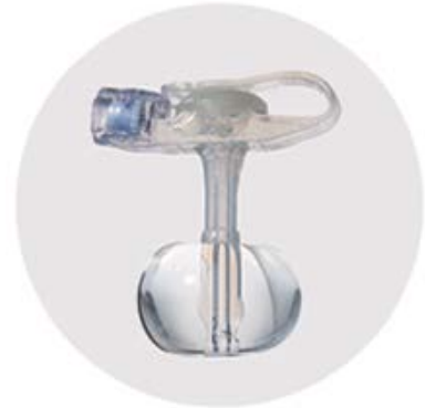
Exempel på gastrostomiport/knapp, källa se Referenser och länkar

Gastrostomiport eller knapp är en lågprofilerad gastrostomi med koppling i hudplan. En mellankoppling, s.k. matningsslang, sätts på vid måltid och kopplas bort när måltiden är avslutad. Endoskopienhet provar ut lämplig längd och tjocklek med hjälp av särskild mätsticka. Liksom gastrotuben hålls den på plats i magsäcken med en vattenfylld kuff medan det utvändiga stoppet utgörs av kopplingen.