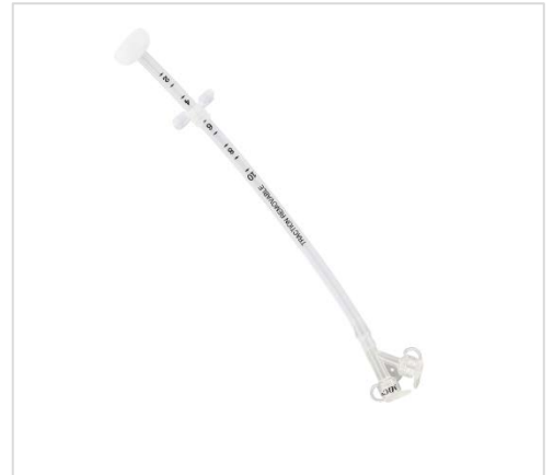
Exempel på PEG, källa se Referenser och länkar

PEG:en hålls på plats i magsäcken med en platta (ej ballong/kuff) som ligger an mot magsäcksväggen och med en stopplatta på utsidan. Magsäcksväggen är uppdragen mot bukväggen och PEG:en spänns åt med hjälp av yttre stopplattan. PEG:en är inte förankrad med suturer. Kanalen som etableras mellan hud och magsäck är vanligtvis mellan två och fyra cm lång. Cm-gradering finns på katetern.