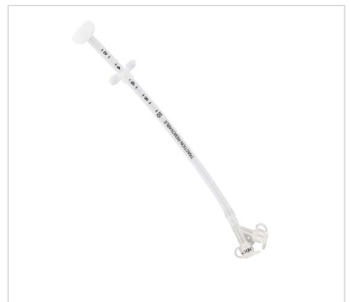
Exempel på PEG, källa se Referenser och länkar

PEG:en hålls på plats i magsäcken med en platta (ej ballong/kuff) som ligger an mot magsäcksväggen och med en stopplatta på utsidan. Magsäcksväggen är uppdragen mot bukväggen och PEG:en spänns åt med hjälp av yttre stopplattan. PEG:en är inte förankrad med suturer. Kanalen som etableras mellan hud och magsäck är vanligtvis mellan två och fyra cm lång. Cm-gradering finns på katetern.