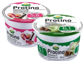
Protino Dessert (GF) Äpple/kanel, rabarber/vanilj