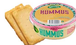
Salta kex och Hummus (LF) Servera med glutenfria kex för GF