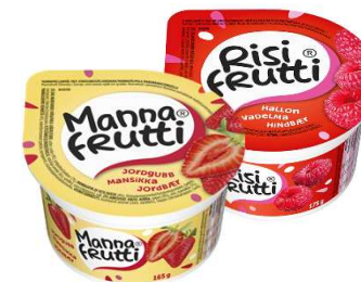
Mannafrutti med jordgubbsylt Risifrutti med hallonsylt (GF)