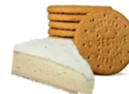
Digestivekex och brieost/ost Servera med glutenfria kex för GF