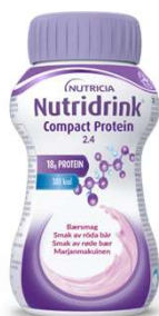
Nutridrink Compact Protein (125ml) Mjölkig näringsdryck lämplig vid sväljsvårigheter, trögflytande konsistens (motsvarande nyponsoppa).