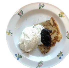
Pannkaka Kan serveras med sylt, glass, grädde och/eller socker

Ovan livsmedel lagerhålls i köket och beställs i Matilda. Mellanmål förbereds på avdelningen innan servering. GF= Glutenfritt. LF= Laktosfritt. Observera att innehållet i produkterna kan komma att ändras. Kontrollera därför alltid innehållsförteckningen vid eventuell allergi!