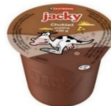
Jacky Chokladpudding (GF)