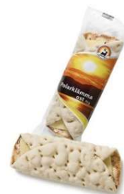
Polarklämma Ost, Kalkon