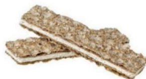
Knäckebröd med fyllning Ost/tomat/basilika, Franska örter