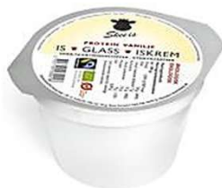
Proteinrik Glass "Skee Is" (GF) Vanilj/hallon