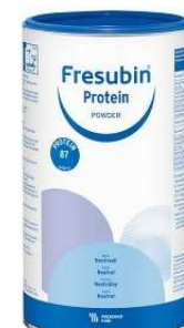
Fresubin Protein Powder Neutral Doseras enligt ordination, konsultera dietist vid behov. Används i varm eller kall dryck, mat eller desserter