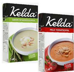
Kelda soppor (GF, slät) Mild tomat, grön sparris Portionsförslag 2 dl berikad med 0,5 dl grädde och 2 msk proteinpulver. Ger 360 kcal och 13 g protein.