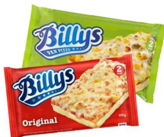
Billys Pan Pizza Original, veggio