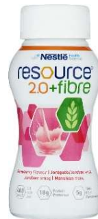
Resource 2.0+ fibre