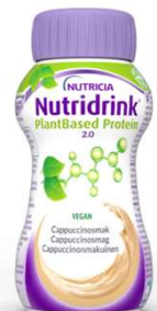
Nutridrink Plantbased Protein 2.0 Utan mjölkprotein.