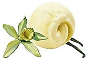
Gräddglass i bägare (GF) Vanilj