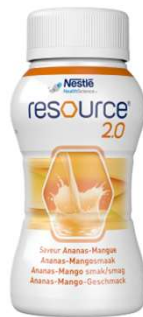
Resource 2.0 utan fiber