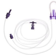
Standard Spike-set (Nestlé) ENFit Artnr. 26330