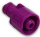
Adapter ENFit till NS2-sond Artnr. 26326