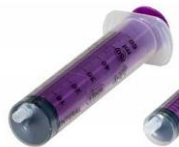
Nutrisafe 2 (Vygon), enteralspruta Artnr. 22649 (20ml) / 22650 (60ml)

Alternativ 2. Vygons enteralsprutor "Nutrifit" passar med ENFit och kan därför användas endast med Vygons adapter: