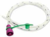
Nutrisafe 2-sond (Vygon)

För att använda Nestlés sondmatsaggregat i en Vygonsond krävs en mellankoppling som omvandlar Vygons säkerhetskoppling till ENFit. Mellankopplingen medföljer inte utan beställs separat. OBS! Nutrisafe 2 används främst på neonatalavdelning och för vuxna patienter som får en nasojejunal sond, detta då nuvarande sond som används vid nasogastrisk sond är för kort.