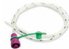
Nutrisafe 2-sond (Vygon)

Alternativ 1. Vygons enteralsprutor "Nutrisafe" passar direkt i en Vygonsond. Ingen adapter behövs: