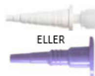
Adapter ENFit- ENLock (artnr 25183/ 26780)