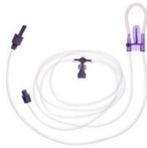
Sondmatsaggregat ( artnr. 26330 )