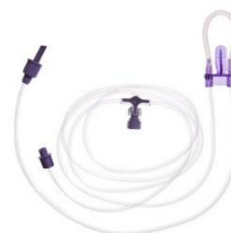
Sondmatsaggregat (artnr. 26330)