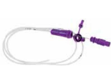
Enteral infart (ENFit)

Nestlés sondmatningsaggregat till Compat Ella ( artnr. 26330 ) har ENFit-koppling och passar därför direkt i enterala infarter med ENFit-koppling: