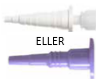
Adapter ENFit- ENLock (artnr 25183/ 26780)