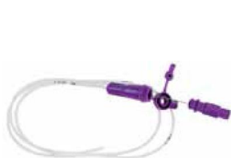
Enteral infart (ENLock)

Nestlés sondmatningsaggregat till Compat Ella (artnr. 26330) har ENFit -koppling och adapter till ENLock medföljer inte . För att Compat Ella -aggregatet ska passa behövs därför en adapter (artnr. 25183 (10-pack) eller 26780 (50-pack)) som beställs separat: