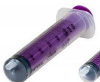
Nutrisafe enteralspruta ( artnr. 22649 (20ml)/ 22650 (60ml) )

Alternativ 2. Vygons enteralsprutor "Nutrifit" ( t.ex. artnr. 26544 ) med ENFit kan användas med Vygons adapter ( artnr. 26326 ):