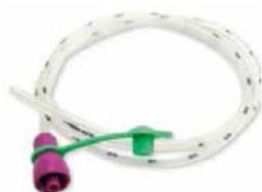
Nutrisafe 2-sond (Vygon)

Alternativ 1. Vygons enteralsprutor "Nutrisafe" ( t.ex. artnr. 22650 ) passar direkt i en Vygonsond. Ingen adapter behövs: