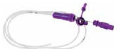
Enteral infart (ENLock)

Enteralsprutorna Nutrifit har en ENFit -koppling och någon ENLock adapter medföljer inte . Därför behövs en adapter (artnr. 25183 (10-pack) eller 25183 (50-pack)) som beställs separat för att sprutorna ska passa i enterala infarter med ENLock :