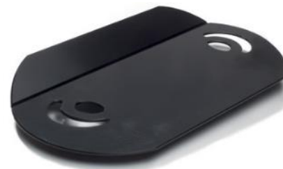
Glidbräda E-board, vikbar