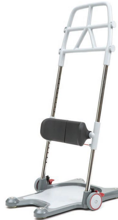
Molift Raiser Pro