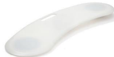
Glidbräda 3B Board