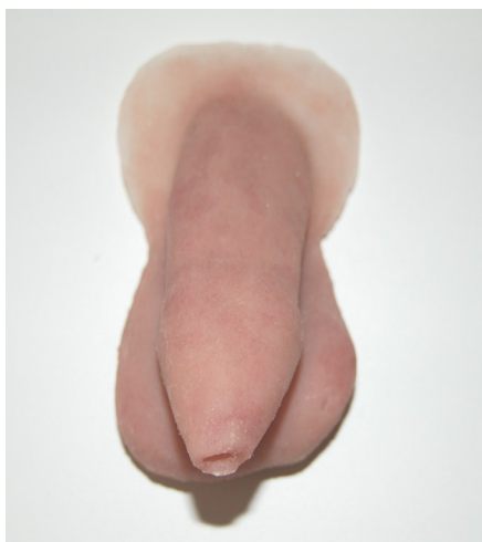
Penisprotes tillverkad av ProtesTeknik i Norr

Protesbäraren bestämmer hur protesen skall utformas.